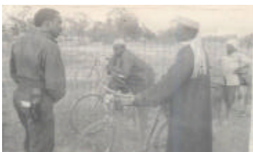
Lors de ses tournées dans le pays, le Président Sankara s'arrêtait et échangeait avec les paysans qu'il rencontrait, sur la vie de la Nation

Le but de la Fondation est d'améliorer les conditions de vie des populations défavorisées.