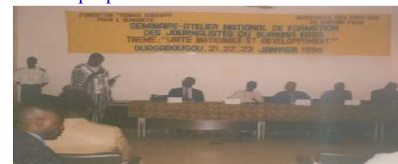
Séminaire de formation de la Fondation: Unité nationale et Développement était à l'ordre du jour.

L'engagement actif du Président du Conseil national de la Révolution (CNR) à améliorer les conditions de vie des populations défavorisées a fait de lui le Chef de l'Etat burkinabè qui a su s'identifier à son peuple.