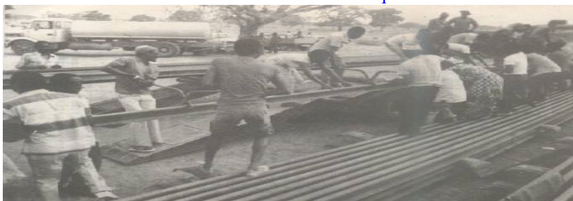
Le peuple a construit de ses mains le chemin de fer

Le 04 août 1983, un système politique de type nouveau s'installait au Burkina Faso. L'Etat burkinabè venait de connaître un changement de régime politique. Le Capitaine Thomas Sankara , issu des Forces Armées nationales, prit le pouvoir d'Etat. Un régime révolutionnaire fut instauré et dénommé «Révolution démocratique et Populaire».