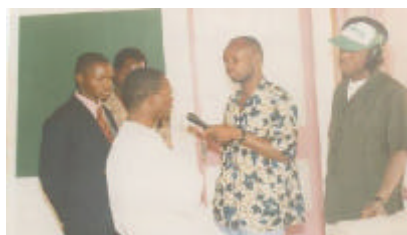
Le Président de la Fondation explique ici à la presse les objectifs de l'organisme

Ces domaines d'intervention sont regroupés en quatre (04) départements: