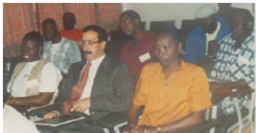
Vue partielle des participants et invités à un séminaire de la Fondation